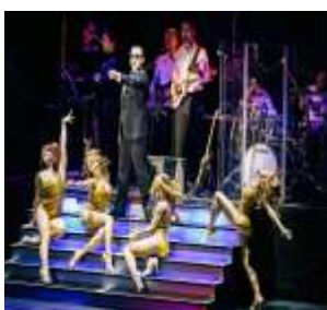
Falco - Das Musical